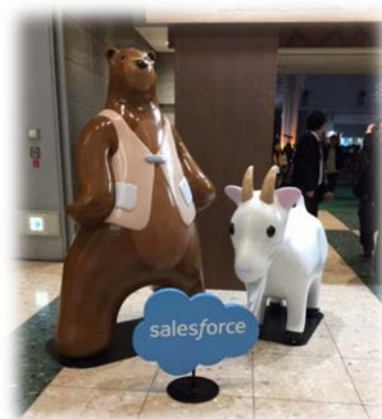
<入場受付の様子 2 >